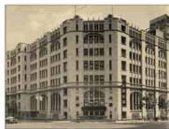
旧肥後橋本社ビル (設計:W・M・ヴォーリズ)