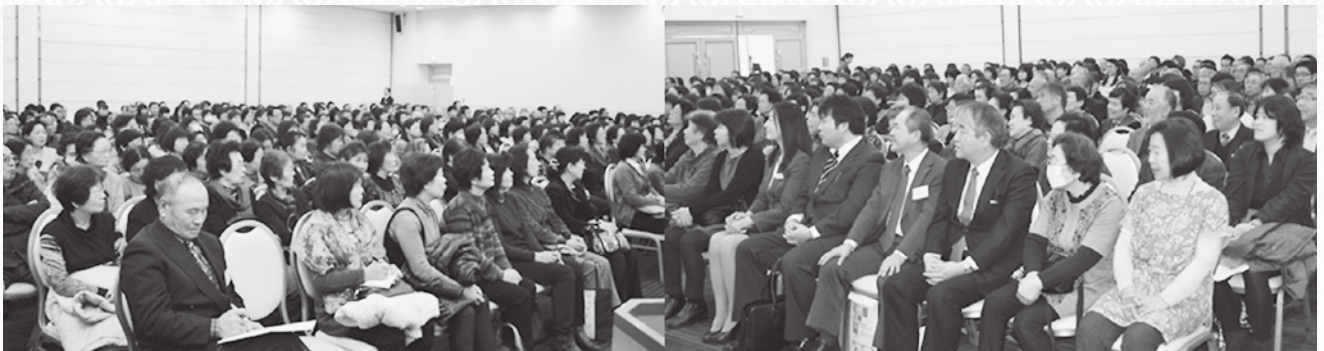
講演会場は、300名を超え「満員御礼」の聴講者となった