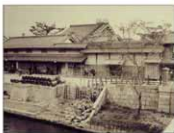
大同生命の礎を築いた 大坂の豪商“加島屋”