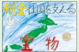
中俣小学校 目黒 こなつ