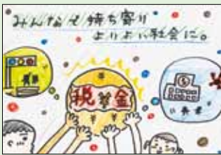
小牛田小学校 信夫叶 愛