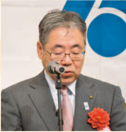
高橋大崎副市長祝辞