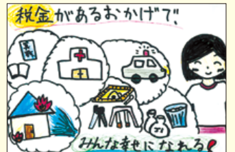
広原小学校 尾形南