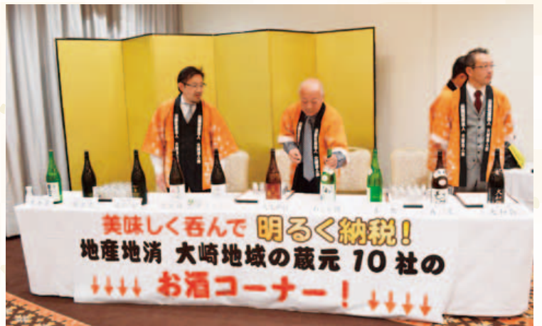
青年部会が祝賀会で地酒の提供を担当