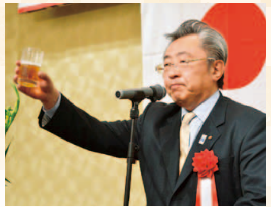
村田古川商工会議所 会頭が乾杯の発声