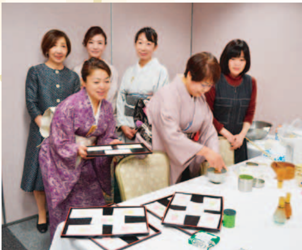
女性部会ではお茶を点てて来賓をおもてなし