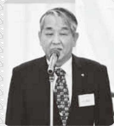
◇市川法人会長の挨拶