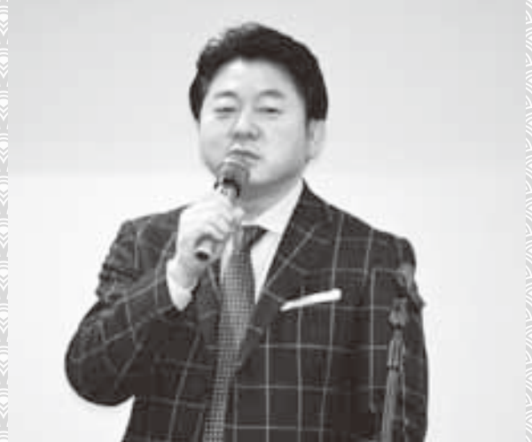
◇舞の海秀平氏の講演は多くの来場者を魅了した!