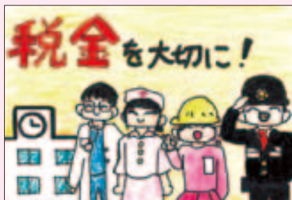
不動堂小学校 平吹 南