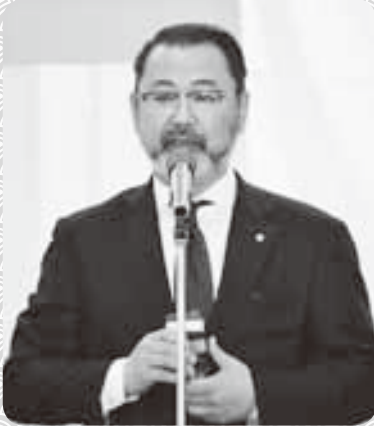
◇菊地古川商工会議所副会頭の乾杯