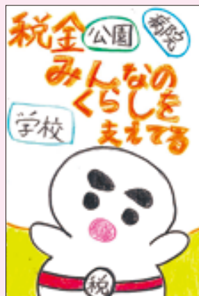
不動堂小学校 千葉 咲和