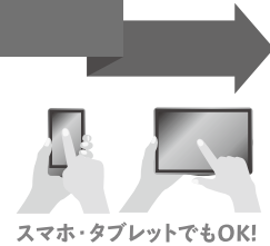
スマホ・タブレットでもOK!

e-Taxを利用して電子申告・徴収高計算書データの送信又は納付情報の登録をした後に、簡単な操作で、あらかじめ届出をした預貯金口座からの振替により、即時又は指定した期日に納付することができる便利な電子納税の手段です。