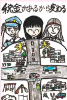
古川第五小学校 千葉のあ